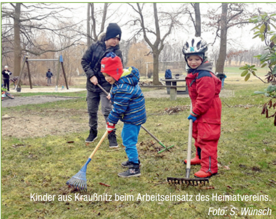
Kinder aus Kraußnitz beim Arbeitseinsatz des Heimatvereins.

Am 19. März folgten zwölf Erwachsene und etliche Kinder dem Aufruf des Natur- und Heimatvereins Kraußnitz e.V. zum alljährlichen Frühjahrsputz rund um den Spielplatz. Es wurden Gräben geräumt, Wege geharkt, abgefallene und abgesägte Äste und Zweige weggeräumt. Der Spielplatz wurde von Unkraut befreit, Müll eingesammelt und eine durch den Sturm schief gestellte junge Linde wieder aufgerichtet. Der Vorstand des Heimatvereins dankt allen tatkräftigen Helfern, klein und groß! Es ist immer wieder erstaunlich, wie viel durch gemeinsames Anpacken in kurzer Zeit erreicht werden kann!