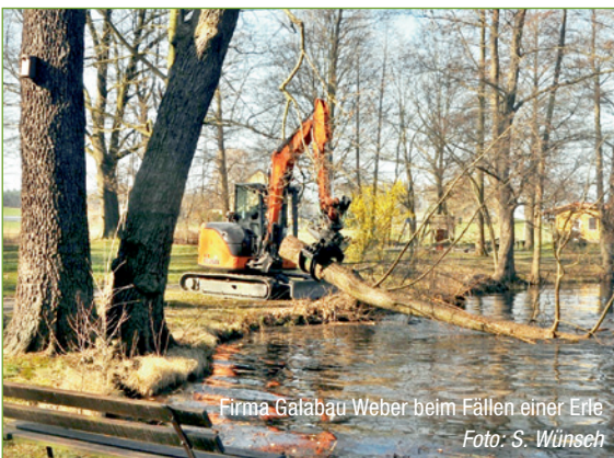
Firma Galabau Weber beim Fällen einer Erle

Ende März fuhren dann Bagger und Hubbhühne der Firma Galabau Weber aus Lauchhammer vor und erledigten im Auftrag der Gemeinde sowie in Abstimmung mit Umwelt- und Denkmalamt die Kronenpflege von insgesamt elf alten Eichen und die Fällung von 22 Erlen, die geschädigt, teilweise morsch, vom Pilz bewachsen waren oder sehr schief standen. Durch diese Maßnahme wurde die dringend notwendige Verkehrssicherheit auf den Wegen im Park und die Wirkung als Parkanlage wiederhergestellt. Der Heimatverein Kraußnitz hat die Gemeinde bei der Absprache mit den Ämtern und der ausführenden Firma vor Ort unterstützt und beteiligt sich an der Kosten der Parksanierung mit einem Teil des Preisgeldes, das mit dem eku-Zukunftspreis 2021 gewonnen wurde. Die Pflanzung der zahlreichen für Bienen und andere Insekten wertvollen Gehölze wurde in Abstimmung mit dem Denkmalamt auf den Herbst gelegt. Der genaue Pflanz-Termin und die Liste der ausgewählten Gehölze werden in einem der nächsten Gemeindeblätter bekanntgegeben. Zur Finanzierung der Gehölze wurden bereits zehn Baumpatenschaften vereinbart. Wir danken an dieser Stelle den Paten für die Unterstützung des Projektes und freuen uns auf die gemeinsame Pflanz-Aktion. Weitere Interessenten für Baumpatenschaften können sich gerne an Sebastian Wunsch unter 0160-4913772 oder wunsch@posteo.de wenden und sich einen Baum oder einen Strauch reservieren lassen.