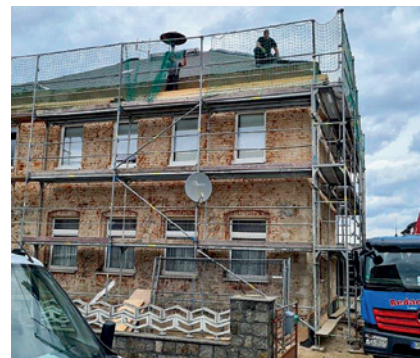
Bauarbeiten am Dorfgemeinschaftshaus Böhla b.O. – Das Dach wird neu gedeckt.