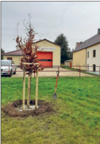
Hainbuche für OT Schönborn.

Mit dieser Pflanzmaßnahme wird ein Beitrag für die Umwelt und das Klima geleistet. Ein ausgewachsener Baum bindet Kohlenstoff und produziert große Mengen Sauerstoff. Er ist wichtiger Lebensraum für Insekten und Vögel und dient darüber hinaus als Naturschwamm durch seine Fähigkeit Wasser zu speichern.