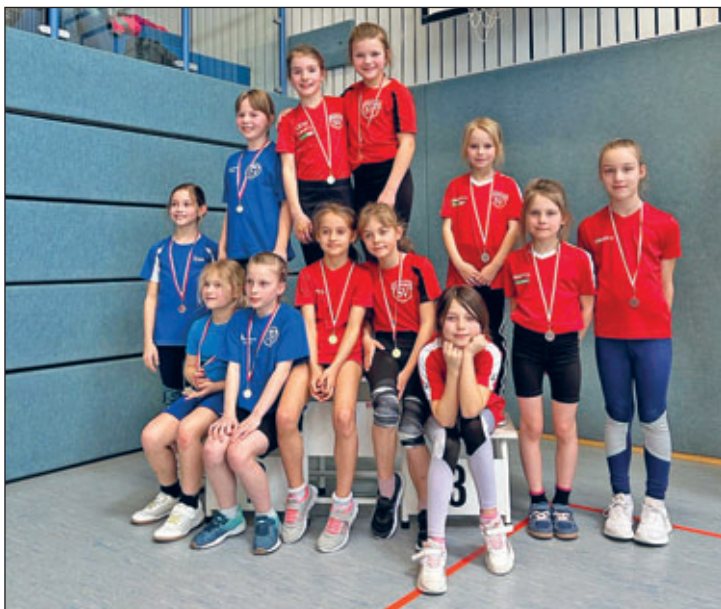
Im Bild Gold und Bronze für die Lampertswalder Staffeln der acht- und neunjährigen Mädchen.