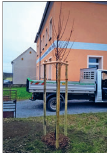
Winterlinde für OT Böhla b.O.