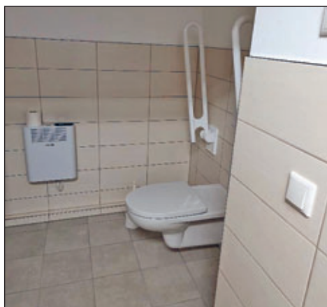
In einen alten Lagerraum wurde die neue behindertengerechte Toilette eingebaut