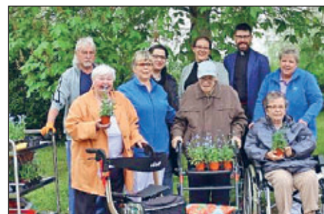
Im vergangenen Jahr haben sich u. a. Bewohnerinnen und Bewohner des Seniorenhauses „Albert Schweitzer“ über die Blumenspende gefreut.