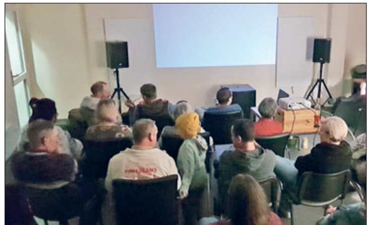
Bröbnitzer warten gespannt auf den Überraschungsfilm

Lange haben die Bewohnerinnen und Bewohner von Bröbnitz darauf gewartet. Dann war es soweit. Ihr Dorfgemeinschaftshaus wurde endlich saniert. Am 5. Januar 2024 fand die Einweihungsfeier statt. Mit einem größeren Innenraum, modernen Sanitäranlagen und einer funktionsfähigen Heizung bietet der ehemalige Konsum des kleinen Ortes ab sofort eine Möglichkeit, sich in gemütlicher Atmosphäre zu treffen, auszutauschen oder ausgelassen zu feiern. So organisierte kurzerhand der Ortschaftsrat für den 24. Februar einen gemeinsamen Filmabend. 23 Interessierte kamen zusammen. Das ist eine erfreuliche Zahl für einen Ort mit rund 80 Einwohnern. Gezeigt wurde eine skandinavische Komödie, in der es auf groteske Art und Weise um menschliche Grundbedürfnisse, wie die Zugehörigkeit zu einer Familie geht. Der schwarze Humor kam bei den Zuschauern gut an. Im Anschluss an den Film tauschten sich die Gäste dabei nicht nur über die Inhalte aus. Auch allgemeine Themen fanden Anklang. „Die hohe Resonanz auf die kurzfristige Einladung zeigt, dass Dorfgemeinschaftshäuser ein wichtiger Bestandteil für soziales und kulturelles Miteinander im ländlichen Raum sind. Gemeinschaft braucht Räume.“, so Ortschaftsratsvorsitzende Kathrin Mattheus. Die Filmvorführungen in Bröbnitz sollen in Zukunft in regel-