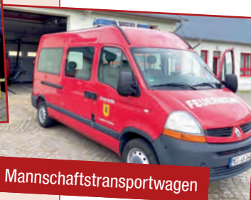
Der MTW - Mannschaftstransportwagen