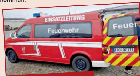
Der ELW - Einsatzleitwagen