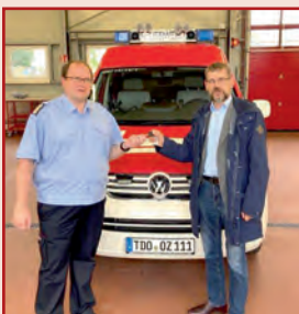
Übergabe ELW in Oschatz

Einen gebrauchten ELW (Einsatzleitwagen) wurde der Gemeinde Schönfeld am 14.09.2022 von der Stadt Oschatz übergeben. Die Gemeinde Schönfeld stattete diesen mit allen elektronischen Geräten und Funktechnik neu aus, sodass die FFW der Gemeinde Schönfeld nun wieder ein Stück besser ausgerüstet ist.