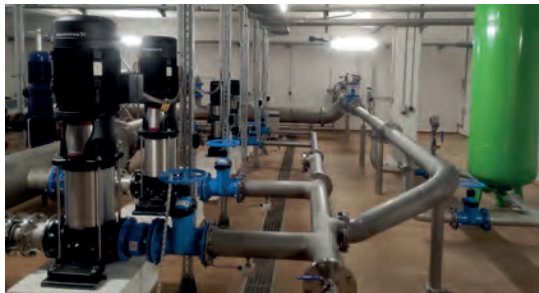
In der DEA Großenhain-West investierte die WRG in neue Pumpen.

Über die DEA Großenhain-West werden das Stadtgebiet Großenhain sowie angrenzende Ortschaften versorgt. Im Bedarfsfall können der Hochbehälter Kupferberg und die umliegenden Orte direkt gespeist werden. Die Anlage, die aus dem Jahr 1997 stammt, ist in die Jahre gekommen. Durch eine veränderte Betriebsweise hat die Anlage nicht mehr effizient gearbeitet. Deshalb wurde dieses Jahr in vier neue Pumpen investiert, die optimal an den neuen Betriebspunkt angepasst sind. Somit kann ein erheblicher Teil an Energie eingespart werden. Auch das Rohrsystem wurde hydraulisch an den Stand der Technik angepasst. Die Umsetzung dieser Maßnahme kostete rund 95.000 Euro.