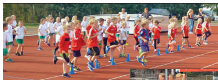
Erwärmung Klasse 1