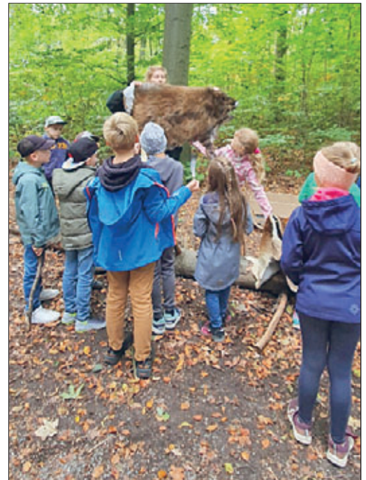
Kinder im Sachsenforst

Ausflüge nach Cottbus ins Planetarium und in den Sachsenforst Dresden krönten dann unsere Ferienzeit. Unsere Minis und Maxis nutzten ebenfalls die Ferien für einen Kinobesuch in Großhain.