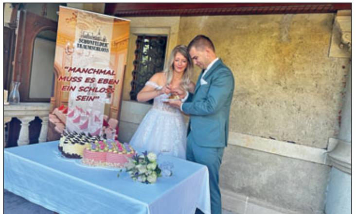
Traditionell, der Anschnitt der Hochzeitstorte, welche von der Bäckerei Tobollik gesponsert wurde.