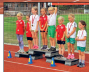
Siegerehrung Klasse 1 Mädchen