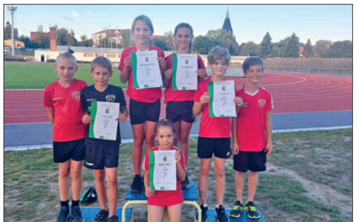
das Lampertswalder Team